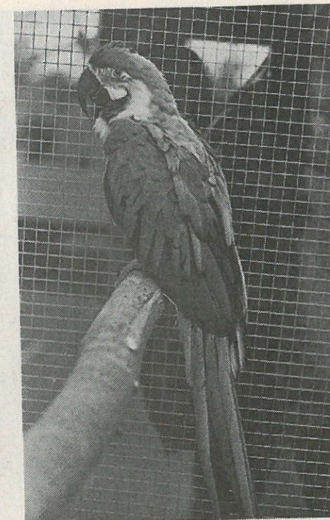
In zahlreichen Käfigen waren die farbenprächtigen Tiere aus allen Erdteilen vom Vogelzuchtvereins Freudenstadt ausgestellt.